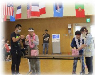
誰の名前が書かれているかな？