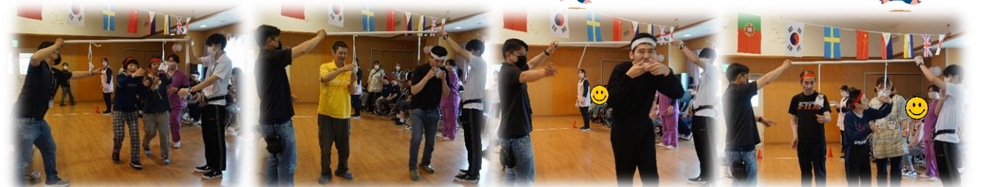
ガンバレーファイター♪♪